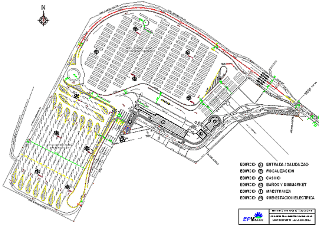
LÁMINA Nº 1